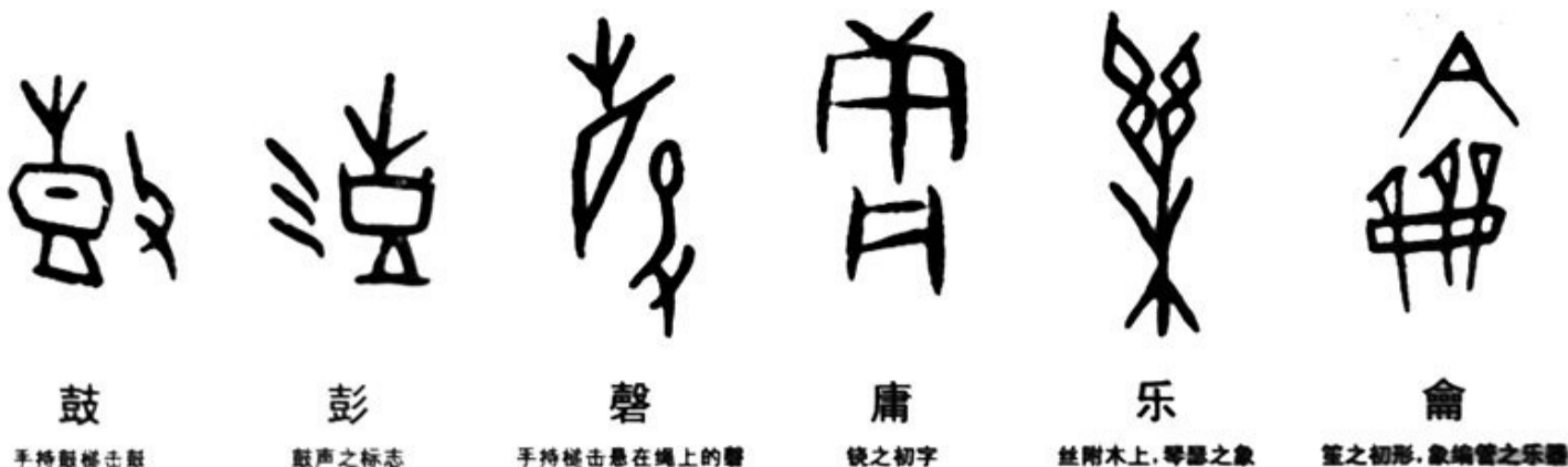
鼓 手持鼓槌击鼓 彭 鼓声之标志 磬 手持槌击悬在墙上的磬 庸 镜之初字 乐 丝附木上，琴瑟之象 龠 笙之初形，象编管之乐